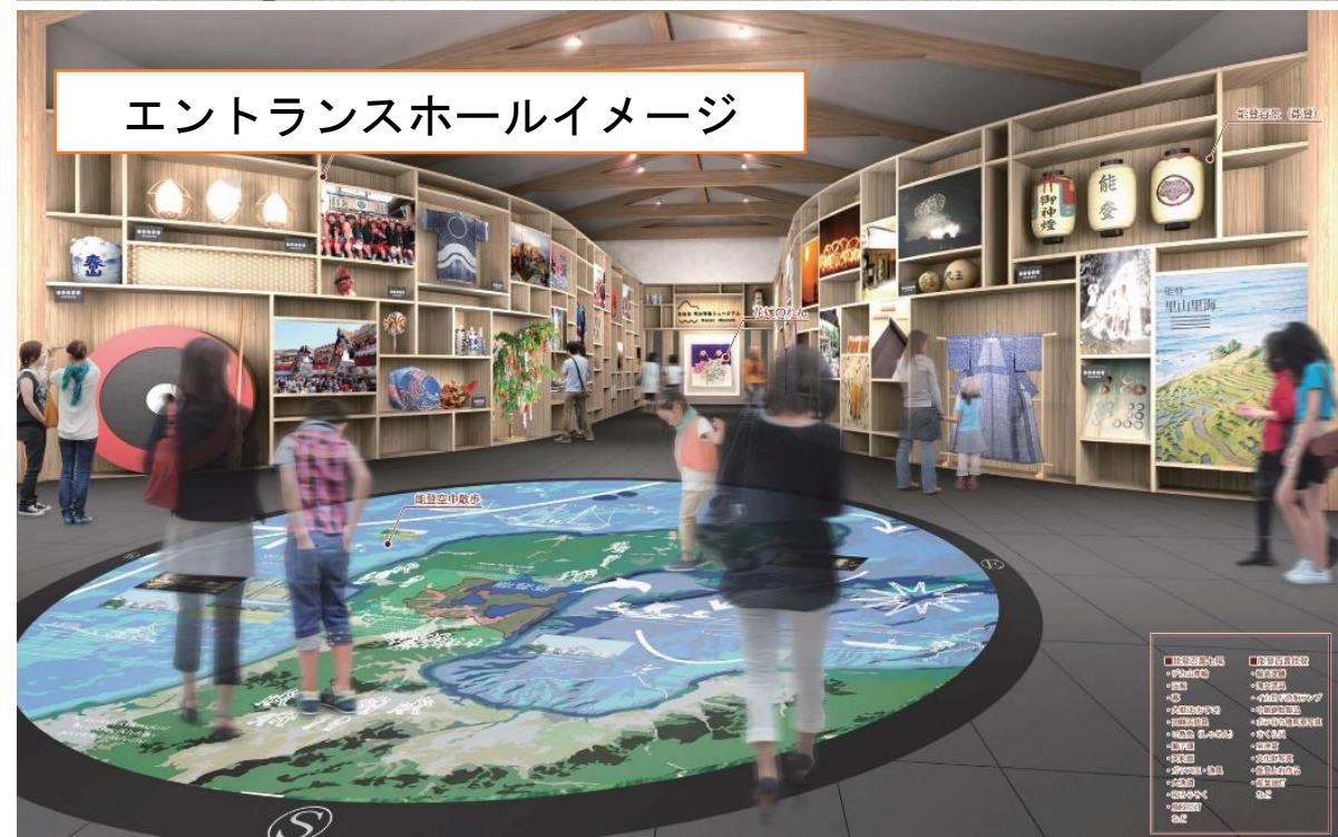
エントランスホールイメージ