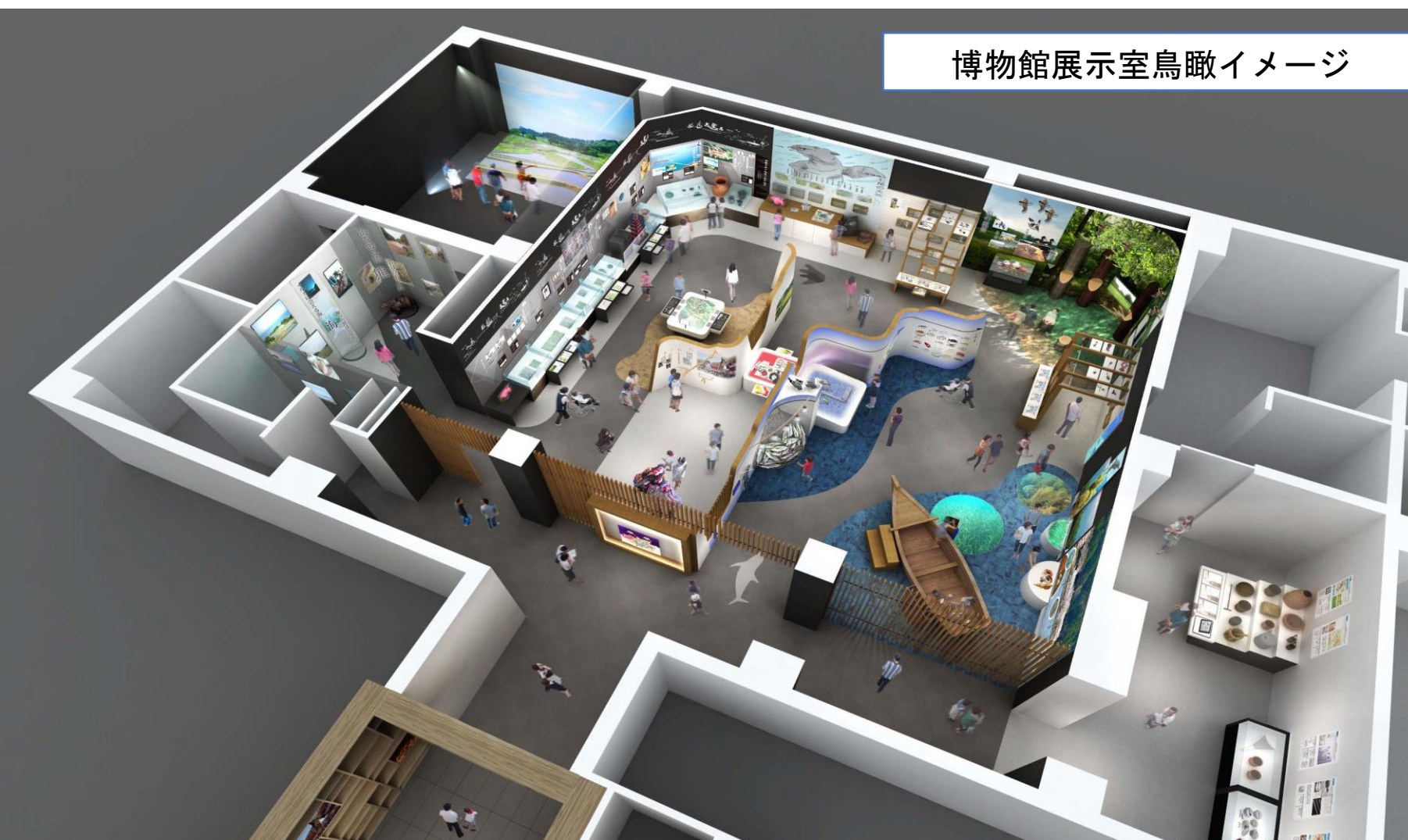
博物館展示室鳥瞰イメージ