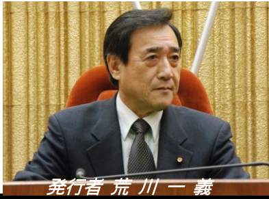
発行者 荒川 一義